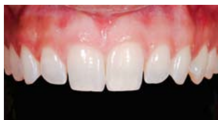
Минимално инвазивна естетична модификация на усмивката с порцеланови фасети