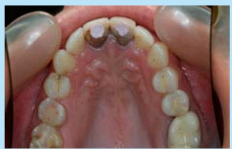
Начална ситуация на клиничния случай за демонстрацията на д-р Лои - централни резци с нарушена естетика и проведено ендодонтско лечение